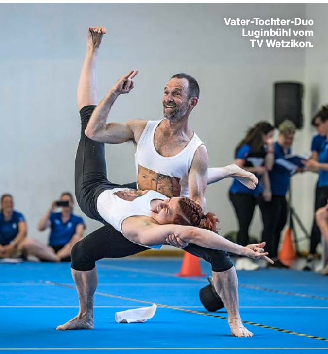
Vater-Tochter-Duo Luginbühl vom TV Wetzikon.