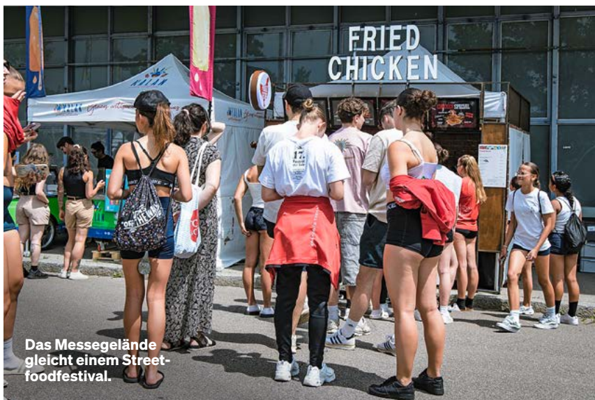
Das Messegelände gleicht einem Street-foodfestival.